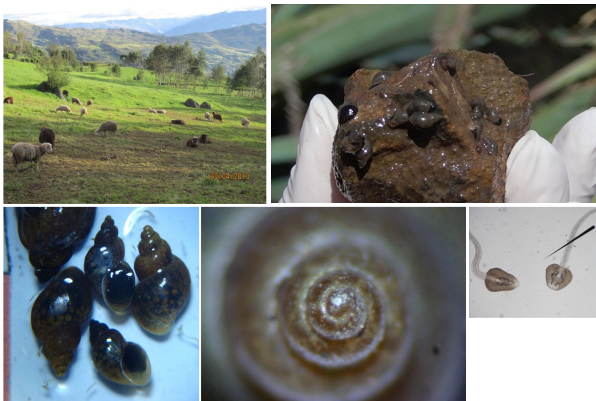
Figura 1. Características ecológicas de la zona de estudio (superior izquierda), caracoles Lymnaea viatrix y cercarias detectadas en uno de ellos (inferior derecha, 400A). Fotos originales.

FUENTE: Censo Estadístico La Libertad, INEI, 2012.